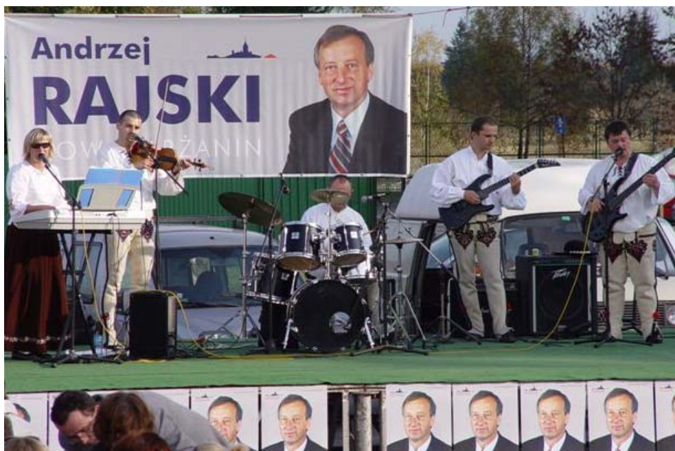
Zdjęcie nr 2. Piknik wyborczy w dniu 22.10.2006r