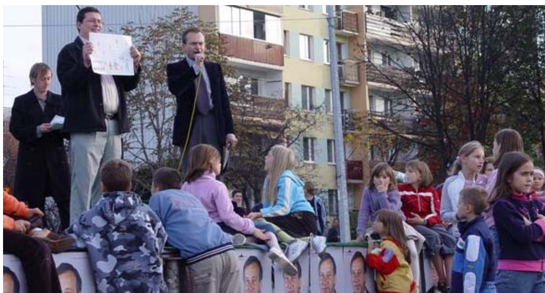
Zdjęcie nr 4 Licytacja podczas festynu.

W dniu 22 października 2006 r. KWW Ruch Obywatelski Nowotarżanie zorganizował piknik wyborczy, na którym zaprezentowano kandydatów na radnych, kandydata na burmistrza oraz jego plany na przyszłość. Piknik połączono z konkursem plastycznym dla dzieci „Nowy Targ moje miasto”. Obecne na pikniku dzieci malowały rysunki, które w przerwie między kolejnymi prezentacjami były licytowane . Dochód z licytacji przeznaczono dla jednego z nowotarskich stowarzyszeń na działalność charytatywną – opieką nad niepełnosprawnymi dziećmi. W licytacji udział brali głównie kandydaci do rady oraz kandydat na burmistrza.